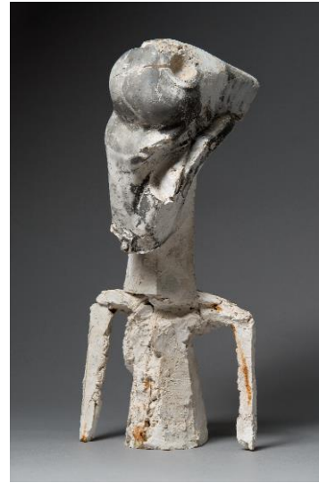
Zbyněk Sekal, Hlava, 1997, NGP