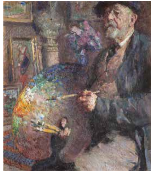
Vlastní podobizna: Moje paleta, 1946, soukromá sbírka

Vaše Lektorské oddělení Sbírkou umění 19. století Národní galerie v Praze