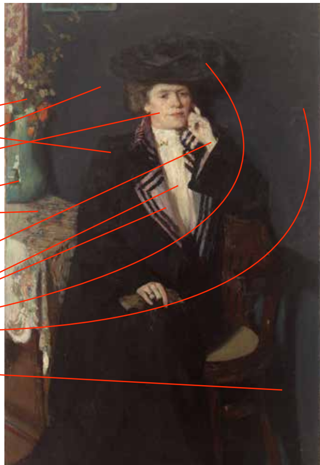
Dáma v černém šatě, (1904), Národní galerie v Praze