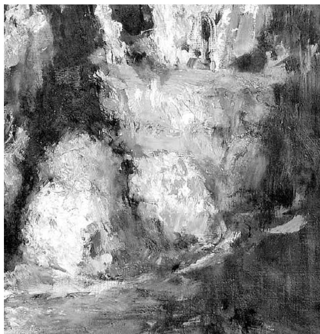
Zátiší s čínským bůžkem (výřez), 1952 Galerie Kodl

Odstupte od obrazů a podívejte se na celek. Pozorujte, z jakých barev jsou vytvořeny předměty, které tvoří zátiší nebo postavy v zahradě.