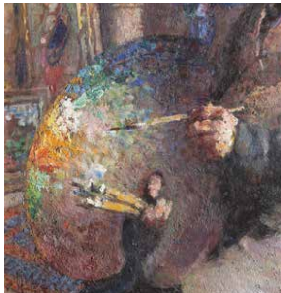
Vlastní podobizna: Moje paleta (výřez), 1946, soukromá sbírka (obraz naleznete v první místnosti výstavy)

Podívejte se na malířovu paletu – jaké barvy Ludvík Kuba používal? Dokázali byste je všechny pojmenovat?