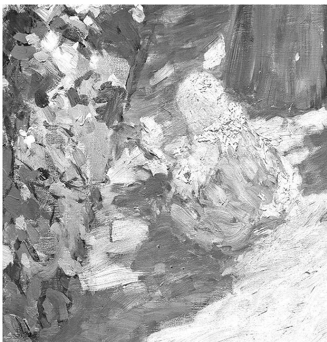
Mezi růžemi (výřez), 1906 Národní galerie v Praze

Podívejte se zblízka na detaily dvou obrazů a doplňte barvy, které použil Ludvík Kuba.